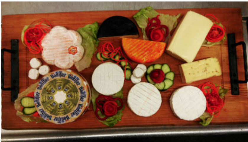
Käseplatte mit verschiedenen Käsesorten